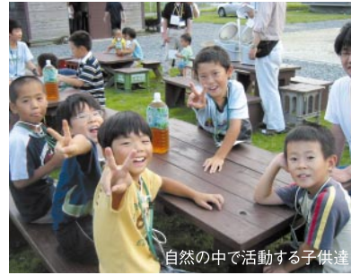
自然の中で活動する子供達

現在、県内の廃校を拠点に地元住民の方と協力して子供達を受け入れる「根っこ塾(仮称)」を展開しよう と準備をしています。自然体験、伝承遊び、林業体験や農業体験を通じて 地元のおじいちゃん、 おばあちゃんとふれあう中で子供達は同世代の友達だけではなく、年齢の離れた他人との関わり方を学びます。日本の美徳である思いやり、敬意、感謝の心をきちんと身に付けた人間づくりを目指します。